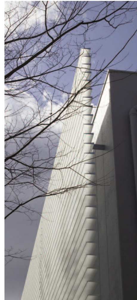
建物北東端を見る