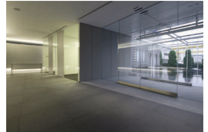
エントランスホールよりアプローチを見る