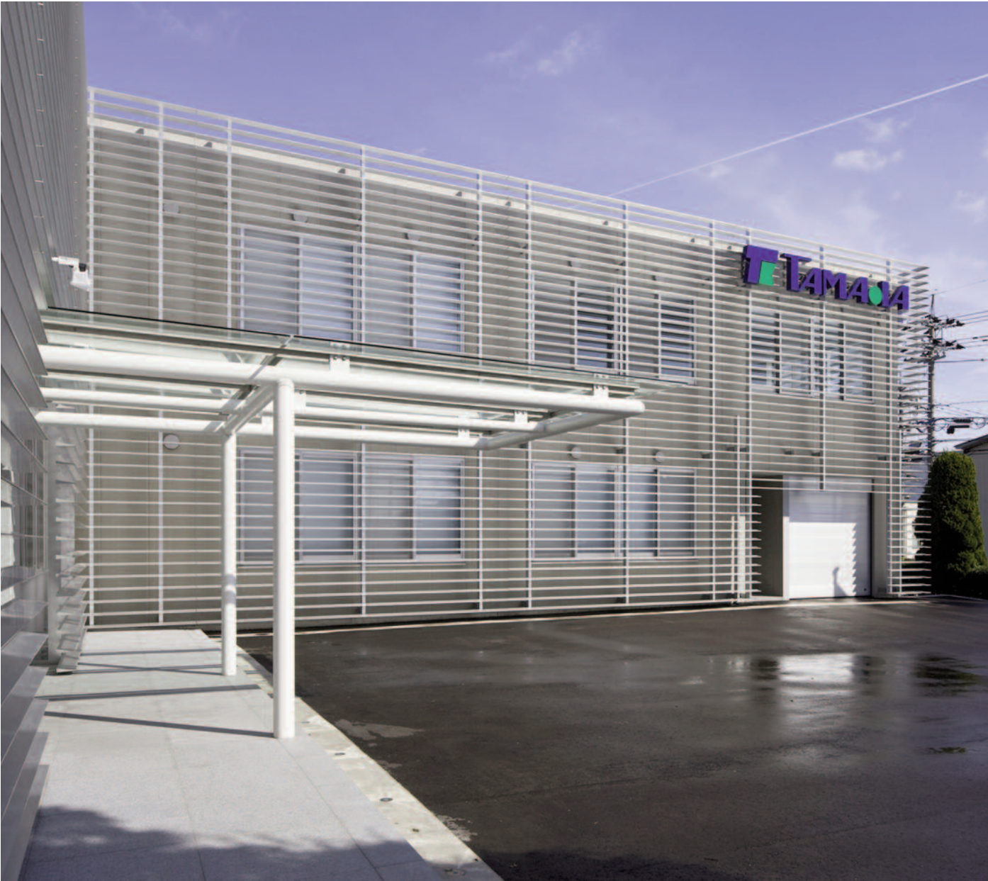
ガラスキャノピーを通して建物南端を見る

Renovation of Headquarters Office Building of Tamada Industries Inc. Kanazawa-shi, Ishikawa