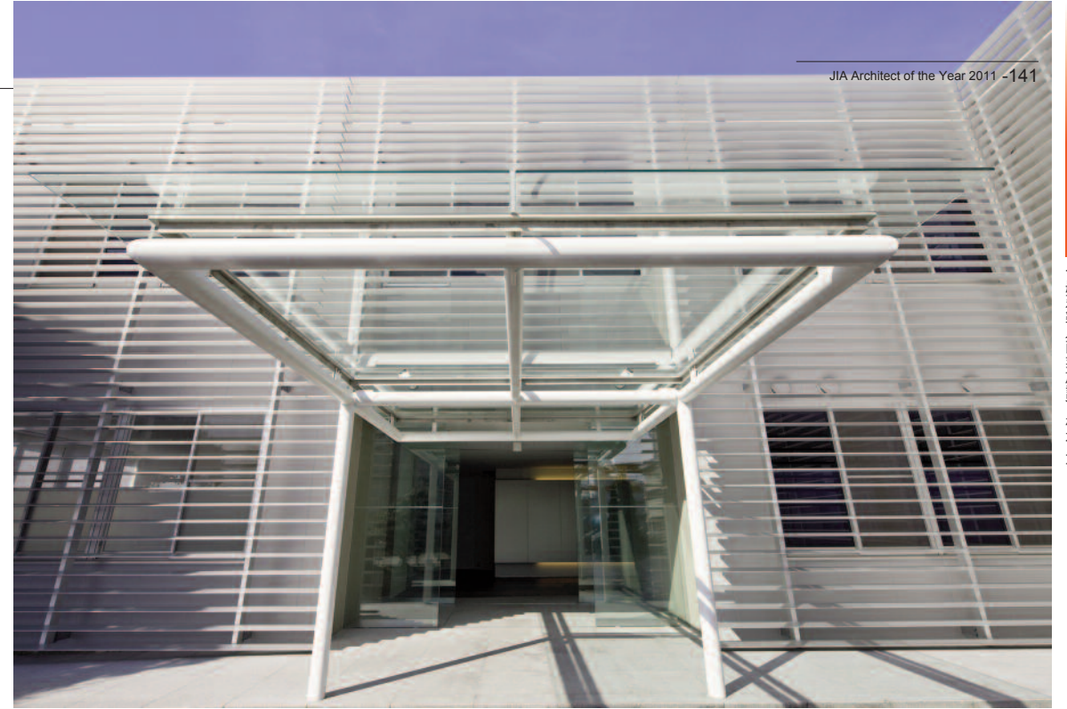
ガラスキャノピーを通してエントランスを見る

The renovation is of the headquarters office building which stands with a reservoir tank manufacturing factory. Expansion of the original building is covered with a 70m aluminum screen louver for a new look. The edges of the screen louver are suspended which shows parts of the building that are very unique. The whole screen louver gives the impression of the form of the building. This renovation is to be a reflection of the bright attitude of the growing company.